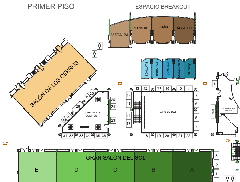
Nómina de los stands